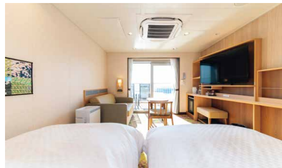
さんふらわあ「スイートルーム」