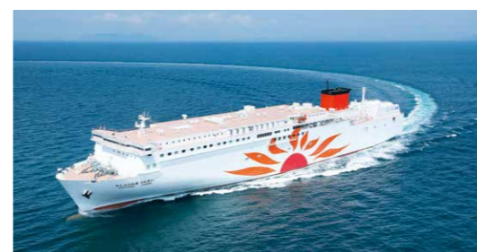
「さんふらわあ くない」

大阪-別府航路において2023年1月13日に就航した「さんふらわあ くない」が、シップ・オブ・ザ・イヤー2022の大型客船部門賞を受賞しました。選考では「環境負荷の小さいLNG燃料のカーフェリーの本邦第1船であること」が高く評価され、部門賞に選出されました。今回の受賞は、「さんふらわあ さつま」「さんふらわあ きりしま」(シップ・オブ・ザ・イヤー2018 大型客船部門賞)に続き2度目の受賞となります。