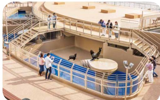
オーシャンテラスでは海風を感じながらベンチで食事をしたり、写真を撮ったり、生き物たちとの圧倒的に近い距離感を味わったり、自由にお過ごしください♪