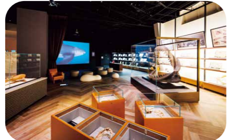
サメの権威である架空の人物・シャークダディ博士が世界中を航海して集めたサメの標本の数々。ホボジロザメやジンベエザメが泳ぐ姿が大画面で再現されるVR水槽も見どころです