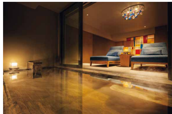
界 雲仙 ご当地部屋「和華蘭の間(客室付き露天風呂)」