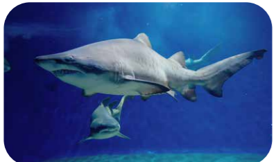
アクアワールド・大洗で出会う「シロワニ」。名前にワニがついているけど、見た目のおりサメの仲間です