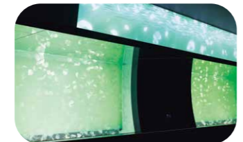
ゆったり漂い泳ぐミズクラゲと「四季」をイメージした色彩変化、そしてゆらぎのある旋律に癒やされるクラゲ大水槽「くらげ365」