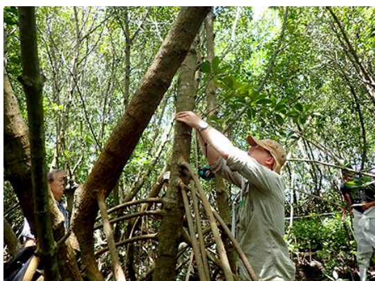
(活動イメージ：マングローブ保全)

初年度の募集では、在モーリシャスの団体や本邦研究機関・団体などから質の高いプロジェクトを多数応募いただきました。本基金運営委員会による公正な選定の結果、「自然環境回復保全プロジェクト」、「地域社会貢献プロジェクト」の2部門計で11件のプロジェクトに対して資金提供することを決定しました。初年度の助成金総額は、約1億円となります。