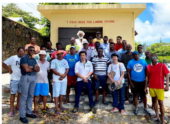
(活動イメージ：水圏資源利用開発)